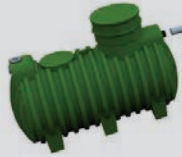
SMART Tank 2500 KIT