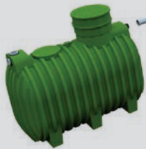
SMART Tank 3500 KIT